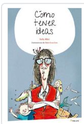
CÓMO TENER IDEAS RHEI, SOFÍA