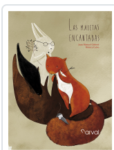
LAS MALETAS ENCANTADAS GISBERT, JOAN MANUEL