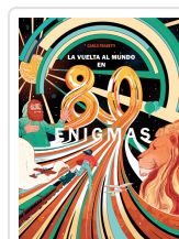
LA VUELTA AL MUNDO EN 80 ENIGMAS FRABETTI, CARLO