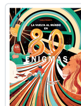
LA VUELTA AL MUNDO EN 80 ENIGMAS FRABETTI, CARLO