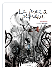
LA PUERTA PEQUEÑA FRABETTI, CARLO