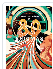
LA VUELTA AL MUNDO EN 80 ENIGMAS FRABETTI, CARLO