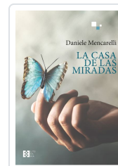
LA CASA DE LAS MIRADAS DANIELE MENCARELLI