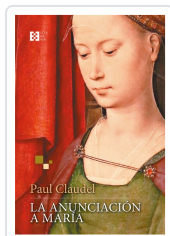
LA ANUNCIACIÓN A MARÍA CLAUDEL, PAUL