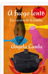
A FUEGO LENTO LANDA APARICIO, ÁNGELA