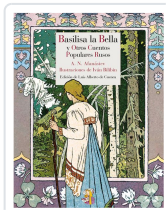
BASILISA LA BELLA Y OTROS CUENTOS POPULARES RUSOS AFANÁSIEV, ALEKSANDR NIKOLÁYEVICH