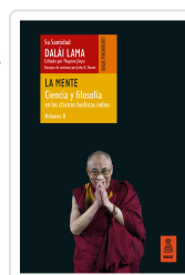
LA MENTE (CIENCIA Y FILOSOFÍA EN LOS CLÁSICOS BUDISTAS INDIOS, VOL. II) LAMA, DALÁI