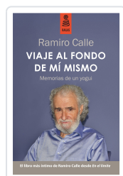
VIAJE AL FONDO DE MÍ MISMO (3ª ED.) CALLE CAPILLA, RAMIRO