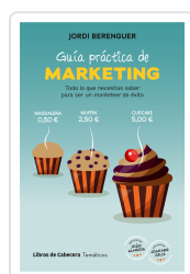
GUÍA PRÁCTICA DE MARKETING BERENGUER VALL-LLOBERA, JORDI