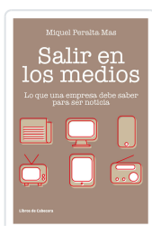
SALIR EN LOS MEDIOS PERALTA MAS, MIQUEL