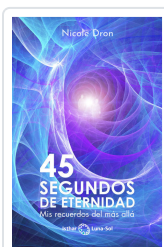
45 SEGUNDOS DE ETERNIDAD DRON, NICOLE