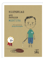
HISTORIAS QUE PARECEN MENTIRA GYEONGSU, KANG