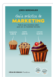
GUÍA PRÁCTICA DE MARKETING BERENGUER VALL-LOBERA, JORDI