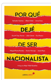
POR QUÉ DEJÉ DE SER NACIONALISTA AA.VV