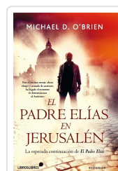
EL PADRE ELÍAS EN JERUSALÉN O BRIEN, MICHAEL