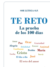
TE RETO. LA PRUEBA DE LOS 100 DÍAS AA.VV.