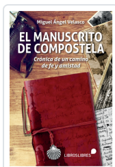
EL MANUSCRITO DE COMPOSTELA MIGUEL ÁNGEL VELASCO