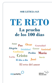
TE RETO. LA PRUEBA DE LOS 100 DÍAS AA.VV.