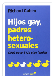
HIJOS GAY, PADRES HETEROSEXUALES COHEN, RICHARD