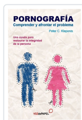
PORNOGRAFÍA. COMPRENDER Y AFRONTAR EL PROBLEMA PETER C. KLEPONIS