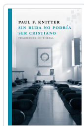
SIN BUDA NO PODRÍA SER CRISTIANO KNITTER, PAUL F.