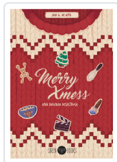
MERRY XMESS: UNA NAVIDAD DESASTROSA G. DE HITA, JAVI