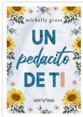
UN PEDACITO DE TI GROSS, MICHELLE