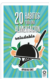
20 HÁBITOS PARA UNA ALIMENTACIÓN SALUDABLE RUÍZ GÓMEZ, AMPARO