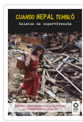
CUANDO NEPAL TEMBLÓ VARIOS AUTORES