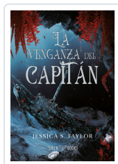
LA VENGANZA DEL CAPITÁN S. TAYLOR, JESSICA