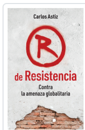
R DE RESISTENCIA CARLOS ASTIZ