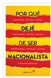
POR QUÉ DEJÉ DE SER NACIONALISTA AA.VV.