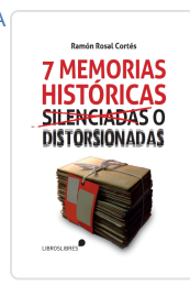
SIETE MEMORIAS HISTÓRICAS SILENCIADAS O DISTORSIONADAS RAMÓN ROSAL