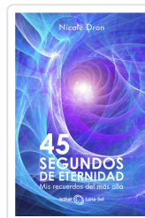
45 SEGUNDOS DE ETERNIDAD DRON, NICOLE