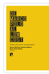
DE MARCO POLO AL LOW COST MARTÍNEZ SÁNCHEZ- MATEOS, HÉCTOR/RUBIO MARTÍN, MARÍA