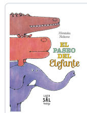
EL PASEO DEL ELEFANTE NAKANO, HIROTAKA