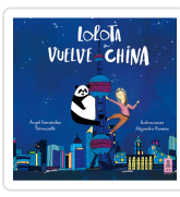
LOLOTA VUELVE A CHINA FERNÁNDEZ FERMOSELLE, ÁNGEL