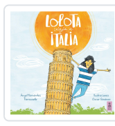
LOLOTA VIAJA A ITALIA FERNÁNDEZ FERMOSELLE, ÁNGEL