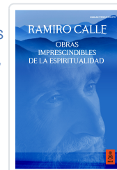
OBRAS IMPRESCINDIBLES DE LA ESPIRITUALIDAD CALLE CAPILLA, RAMIRO