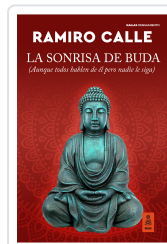
LA SONRISA DE BUDA CALLE CAPILLA, RAMIRO