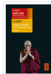
LA MENTE (CIENCIA Y FILOSOFÍA EN LOS CLÁSICOS BUDISTAS INDIOS, VOL. II) LAMA, DALÁI