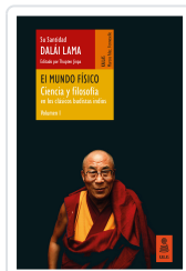
EL MUNDO FÍSICO (CIENCIA Y FILOSOFÍA EN LOS CLÁSICOS BUDISTAS INDIOS, VOL. 1) LAMA, DALÁI