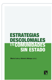
ESTRATEGIAS DESCOLONIALES EN COMUNIDADES SIN ESTADO LOIS, MARÍA / AKKAYA, AHMET