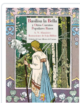
BASILISA LA BELLA Y OTROS CUENTOS POPULARES RUSOS AFANÁSIEV, ALEKSANDR NIKOLÁYEVICH