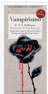
VAMPIRISMO HOFFMANN, E. T. A. [ERNEST THEODOR AMADEUS]