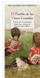
EL PUEBLO DE LAS CINCO COMIDAS SCARFOGLIO, EDOARDO