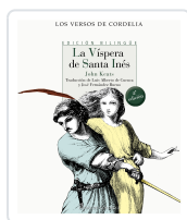
LA VÍSPERA DE SANTA INÉS KEATS, JOHN