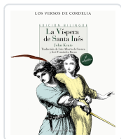
LA VÍSPERA DE SANTA INÉS KEATS, JOHN