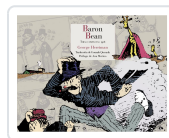
BARÓN BEAN GEORGE HERRIMAN