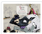
BARÓN BEAN GEORGE HERRIMAN