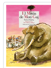
EL MOTÍN DE MOTI GUJ KIPLING, RUDYARD