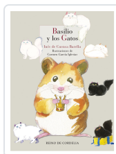
BASILIO Y LOS GATOS DE CUENCA BARELLA, INÉS; DE CUENCA Y PRADO, LUIS ALBERTO