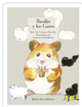
BASILIO Y LOS GATOS DE CUENCIA BARELLA, INÉS; DE CUENCIA Y PRADO, LUIS ALBERTO