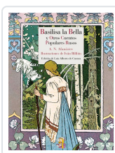
BASILISA LA BELLA Y OTROS CUENTOS POPULARES RUSOS AFANÁSIEV, ALEKSANDR NIKOLÁYEVICH