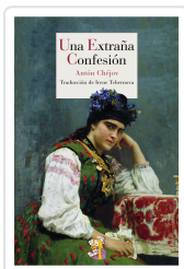
UNA EXTRAÑA CONFESIÓN CHÉJOV, ANTÓN