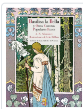
BASILISA LA BELLA Y OTROS CUENTOS POPULARES RUSOS AFANÁSIEV, ALEKSANDR NIKOLÁYEVICH