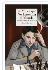
LA MUJER QUE NO ENTENDÍA EL MUNDO TORRES, DAVID