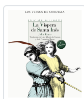
LA VÍSPERA DE SANTA INÉS KEATS, JOHN