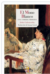
EL MONO BLANCO GALSWORTHY, JOHN