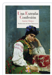
UNA EXTRAÑA CONFESIÓN CHÉJOV, ANTÓN