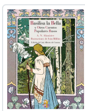
BASILISA LA BELLA Y OTROS CUENTOS POPULARES RUSOS AFANÁSIEV, ALEKSANDR NIKOLÁYEVICH