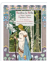
BASILISA LA BELLA Y OTROS CUENTOS POPULARES RUSOS AFANÁSIEV, ALEKSANDR NIKOLÁYEVICH