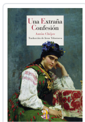
UNA EXTRAÑA CONFESIÓN CHÉJOV, ANTÓN