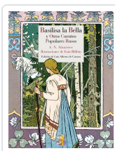
BASILISA LA BELLA Y OTROS CUENTOS POPULARES RUSOS AFANÁSIEV, ALEKSANDR NIKOLÁYEVICH