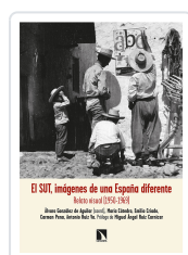
EL SUR, IMÁGENES DE UNA ESPAÑA DIFERENTE GONZÁLEZ DE AGUILAR, ÁLVARO