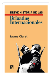
BREVE HISTORIA DE LAS BRIGADAS INTERNACIONALES CLARET, JAUME