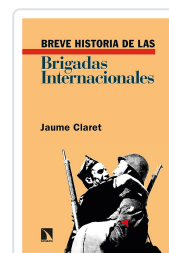
BREVE HISTORIA DE LAS BRIGADAS INTERNACIONALES CLARET, JAUME