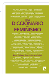
BREVE DICCIONARIO DE FEMINISMO COBO BEDIA, ROSA / RANEA TRIVIÑO, BEATRIZ