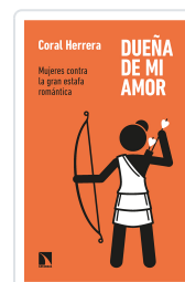
DUEÑA DE MI AMOR HERRERA, CORAL