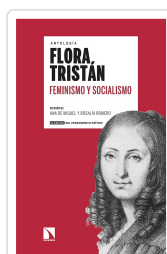
FEMINISMO Y SOCIALISMO TRISTÁN, FLORA