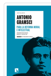
PARA LA REFORMA MORAL E INTELLECTUAL GRAMSCI, ANTONIO