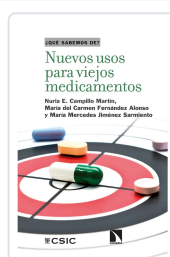
NUEVOS USOS PARA VIEJOS MEDICAMENTOS CAMPILLO MARTÍN, NURIA E. / FERNÁNDEZ ALONSO, MARÍA DEL CARMEN / JIMÉNEZ SARMIE