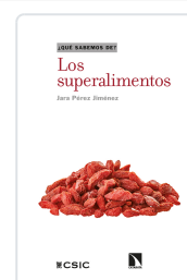
LOS SUPERALIMENTOS PÉREZ JIMÉNEZ, JARA